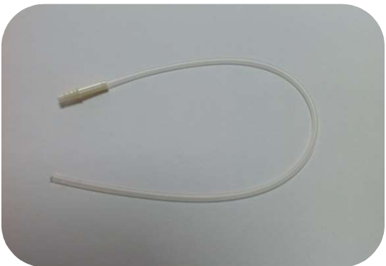
⑤ 吸引カテーテル12 fr 40cm 販売価格 77円 (税込)