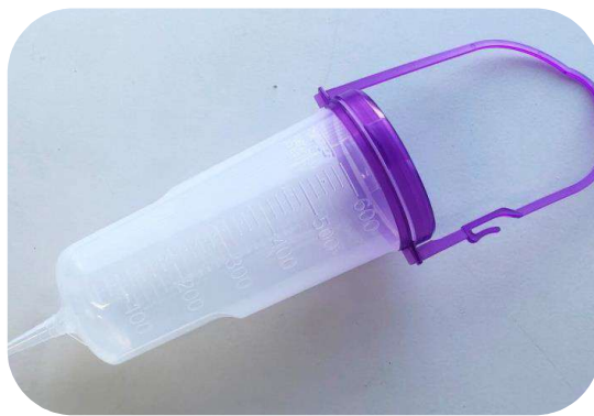
② 栄養セット ボトル600mlのみ (パープル) (栄養セットチューブとの接続部は変更なし) 販売価格 495円 (税込)