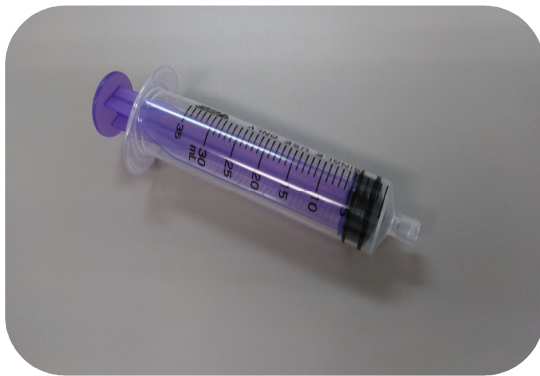
④ ボーラス用注射器30ml (パープル) (国際規格準拠製品) 販売価格 176円 (税込)