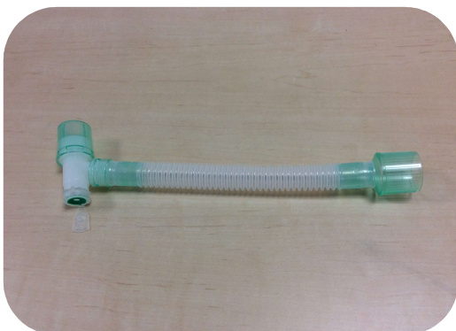
②人工呼吸器用 フレキシブルチューブ 販売価格1,100円(税込)