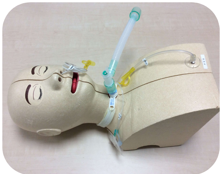
人工呼吸器用 フレキシブルチューブ (メディトレくん装着状態)