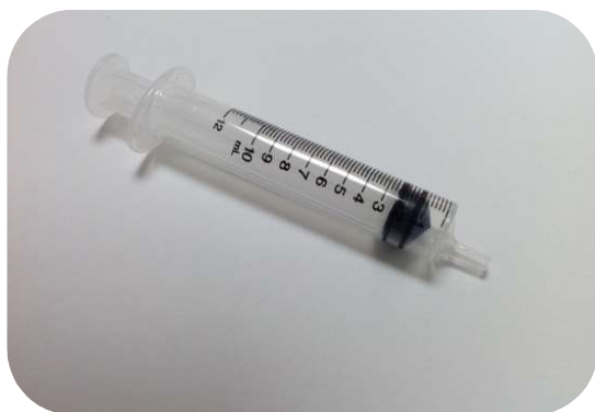
③ 気管カスレカフ用注射器10ml ※(個人販売は出来ません) 販売価格 55円 (税込)