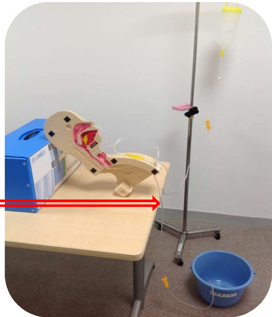
連続排水用チューブ装着状態 (メディトレくん装着イメージ)

※メディトレくんには貯水用に 模擬胃が付いておりますが、 経管栄養を連続で行う場合に バケツ等へ排水をする場合に!!