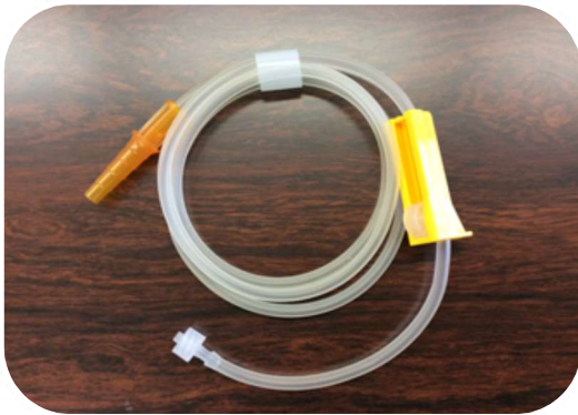
①連続排水チューブ 販売価格330円(税込)

(尚、以下医療器はメディトレくんご購入のお客様限定販売になりますのでご了承下さい。)